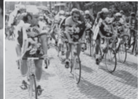
Eronde door Waddinxveen.